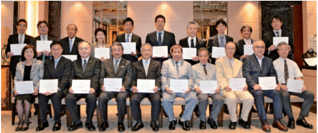
新役員辞令交付式 2015. 7. 28